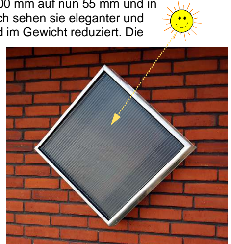
SV2 - auf die Spitze gestellt

Der Regulator zur Steuerung der Ventilatorengeschwindigkeit erfreut sich im neuen Design und kann mehrere zusätzliche Funktionen wahrnehmen.